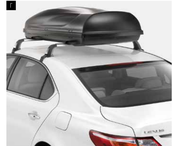
Г. БОКС ДЛЯ БАГАЖУ

Спеціально розроблене для лиж та сноубордів, обладнане замком. Доступне у малому, середньому та великому розмірах, у тому числі кріплення для лиж та сноубордів зі спеціальною системою для більш легкого завантаження та розвантаження.