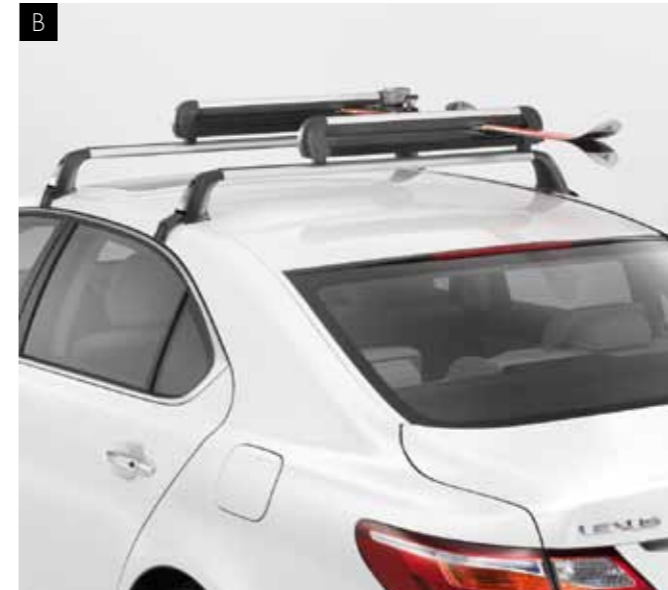
В. КРІПЛЕННЯ ДЛЯ ЛИЖ

Максимальна стабільність при перевезеннях забезпечується кріпленням, що фіксує як колеса, так і раму. Ви можете відрегулювати його висоту при потребі. Унікальна протиугінна система із функцією блокування захищає кріплення і велосипед.