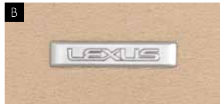
ТЕКСТИЛЬНІ КИЛИМКИ САЛОНУ

Розкішні, стильні, але водночас дуже практичні. Оригінальні текстильні килимки салону мають ідеальний крій та спеціальну фіксацію, що не дозволяє їм ковзати. Килимки зроблено з акувелюру, що доповнює вологопоглинальні властивості килимків LS. Їх представлено у широкій кольоровій гамі для відповідності кольору салону Вашого авто.