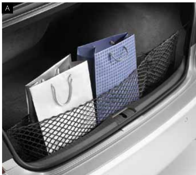
А. ВЕРТИКАЛЬНА СІТКА БАГАЖНИКА

Така проста за своїм принципом, але одночасно така практична. Сітка легко встановлюється на гачки у багажнику і міцно утримує невеликі предмети.