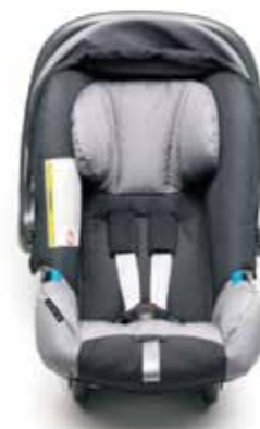
А. ДИТЯЧЕ СИДІННЯ BABYSAFE PLUS

Комфорт та безпека для дітей віком приблизно від народження до 9 місяців (вагою приблизно до 13 кг). Вбудований висувний навіс забезпечує можливість додаткового захисту малюка від сонця та вітру.