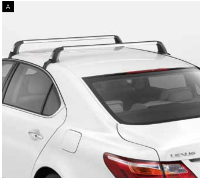
А. КРІПЛЕННЯ ДЛЯ БАГАЖУ

Багажник на даху із функцією блокування, що виконаний з легкого алюмінію, дуже простий у встановленні та використанні. Його доповнює цілий ряд спеціалізованих опцій, таким чином створюючи гнучкість у користуванні всіма можливостями відпочинку.*