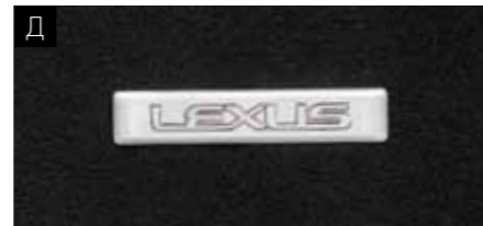
Б. ТЕКСТИЛЬНИЙ КИЛИМОК САЛОНУ (БІЛИЙ)