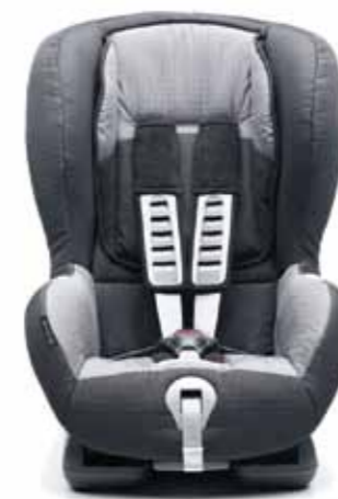
Б. ДИТЯЧЕ СИДІННЯ DUO PLUS ISOFIX

Для дітей у віці приблизно від 9 місяців до 4 років (вагою приблизно 9-18 кг). Для максимальної безпеки сидіння кріпиться до задніх фіксаторів ISOFIX, тобто безпосередньо до корпусу автомобіля. Воно також обладнане спеціальними ременями для попередження нахилу дитини вперед. Бокові крила забезпечують додатковий захист.