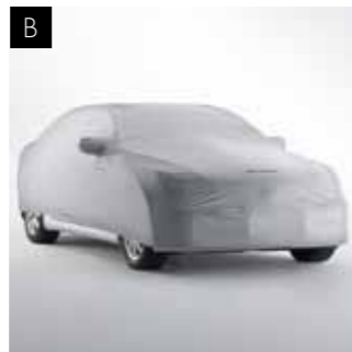
В. ТЕНТ-ПОКРИТТЯ ДЛЯ АВТОМОБІЛЯ

Бризковики чудово підходять до передніх та задніх надколесних ніш LS. Вони зменшують розбризкування на мокрих дорогах та допомагають захистити фарбу Вашого авто від бруду і пошкоджень дрібним камінням.