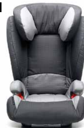
В. ДИТЯЧЕ СИДІННЯ KID

Доступне для дітей у віці приблизно від 4 до 12 років (вагою приблизно 15-36 кг), дитяче сидіння Kid можна регулювати по висоті. Додаткова подушка та підголівник додають комфорту для підростаючих дітей.