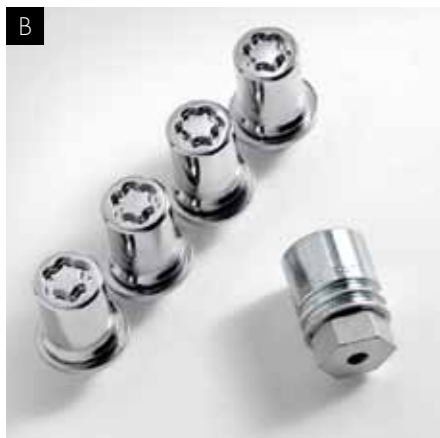
В. СЕКРЕТНІ ГАЙКИ

Імідж потужності та спортивності LS перш за все створюється завдяки дизайну оригінальних 19" легкосплавних дисків. Вони представлені в сріблястому (зображення А) та хромованому (зображення В) кольорах та ідеально підходять моделям, що працюють як на бензині, так і на гібридному паливі.