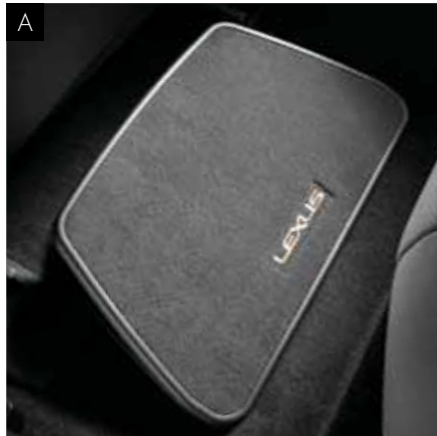
А. ПІДСТАВКА ДЛЯ НІГ

Спеціально розроблена для комфорту пасажирів. Можливість регулювання висоти та комфортне велюрове покриття роблять оригінальну підставку для ніг ідеальним супутником у будь-якій подорожі.