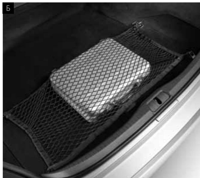
Б. ГОРИЗОНТАЛЬНА СІТКА БАГАЖНИКА

Така проста за своїм принципом, але одночасно така практична. Сітка легко встановлюється на гачки у багажнику і міцно утримує невеликі предмети.