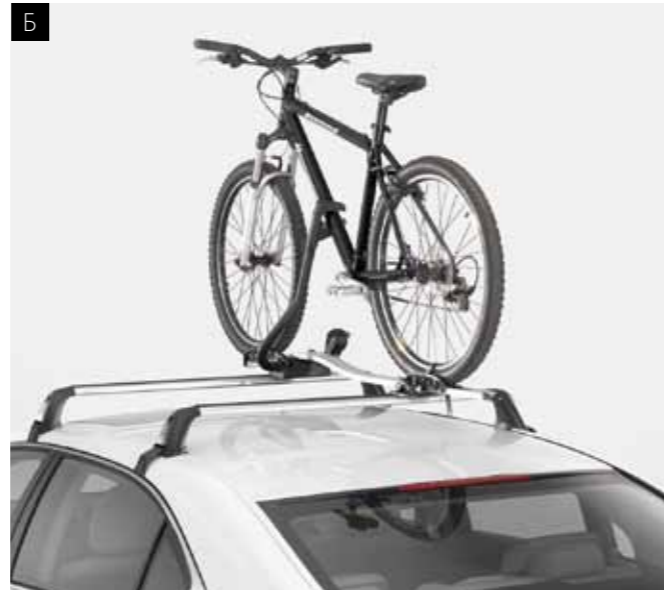
Б. КРІПЛЕННЯ ТИПУ «ПРЕМІУМ» ДЛЯ ВЕЛОСИПЕДІВ

Багажник на даху із функцією блокування, що виконаний з легкого алюмінію, дуже простий у встановленні та використанні. Його доповнює цілий ряд спеціалізованих опцій, таким чином створюючи гнучкість у користуванні всіма можливостями відпочинку.*