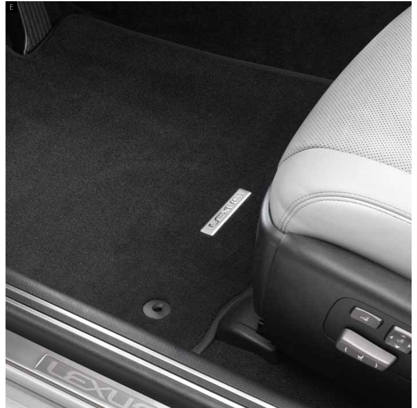
Д+Е. ТЕКСТИЛЬНИЙ КИЛИМОК САЛОНУ (ЧОРНИЙ)