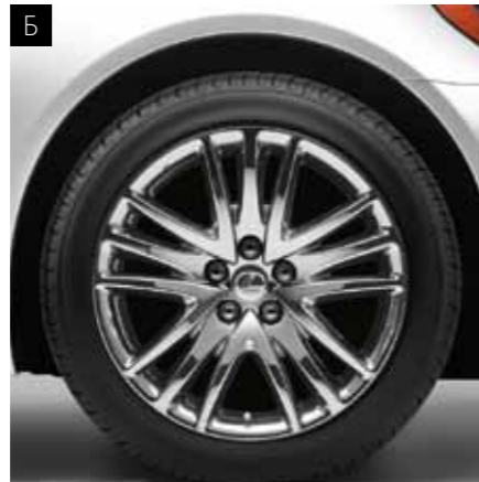
А + Б. ЛЕГКОСПЛАВНІ ДИСКИ 19"

Імідж потужності та спортивності LS перш за все створюється завдяки дизайну оригінальних 19" легкосплавних дисків. Вони представлені в сріблястому (зображення А) та хромованому (зображення В) кольорах та ідеально підходять моделям, що працюють як на бензині, так і на гібридному паливі.