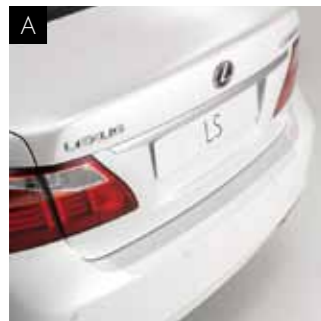
А. ЗАХИСНА ПЛІВКА ЗАДНЬОГО БАМПЕРА

Надійний захист від зносу та подряпин фарби. Прозора плівка ідеально поєднується з контурами заднього бампера LS та легко наклеюється.